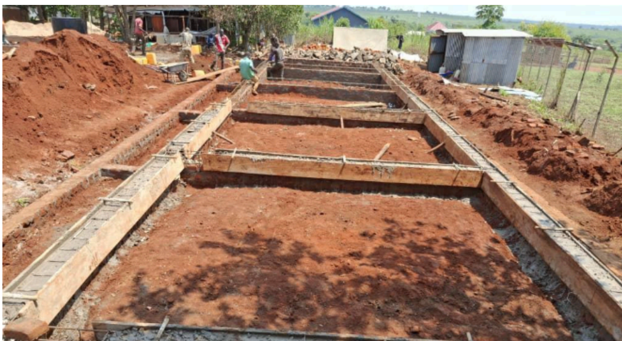
La figura anterior muestra el progreso actual de la construcción de 10 viviendas para el personal.