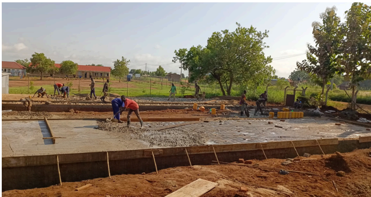
Progreso de construcción.

Durante la fase de construcción, el contratista descubrió que la tubería principal de agua estaba situada en diagonal a través de los cimientos propuestos para las viviendas del personal. Esta situación requirió la aprobación de la excavación de una línea de agua adicional para desviar las tuberías existentes, que debía ser realizada por los socios de WASH Water, Sanitation and Hygiene (Agua, Saneamiento e Higiene) en Adjumani. El JRS recibió la autorización necesaria para el desvío de las tuberías y el apoyo técnico de los socios de WASH. La instalación de las nuevas tuberías de agua ha finalizado y nuestra construcción avanza a buen ritmo.