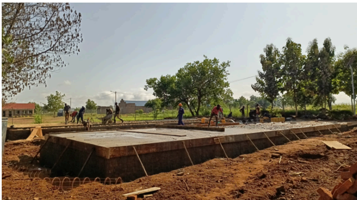
La figura anterior muestra el progreso actual de la construcción de 10 viviendas para el personal.