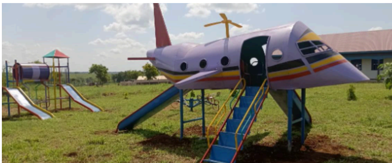
Equipo para guardería en el centro de desarrollo de habilidades JRS.

El proyecto de construcción ha proporcionado a los graduados del Centro de Formación del JRS oportunidades de empleo y valiosas experiencias de aprendizaje para los estudiantes que están matriculados en los diferentes cursos. Estos estudiantes están motivados para aprender de situaciones de la vida real. La participación de los estudiantes de JRS acelera el trabajo, lo que les permite beneficiarse de la experiencia práctica, facilitándoles una futura integración en el mercado laboral. Los estudiantes que participan en la construcción en diversas etapas son estudiantes de Soldadura y Fabricación de Metales, Carpintería, Albañilería y Práctica del Hormigón y Construcción.