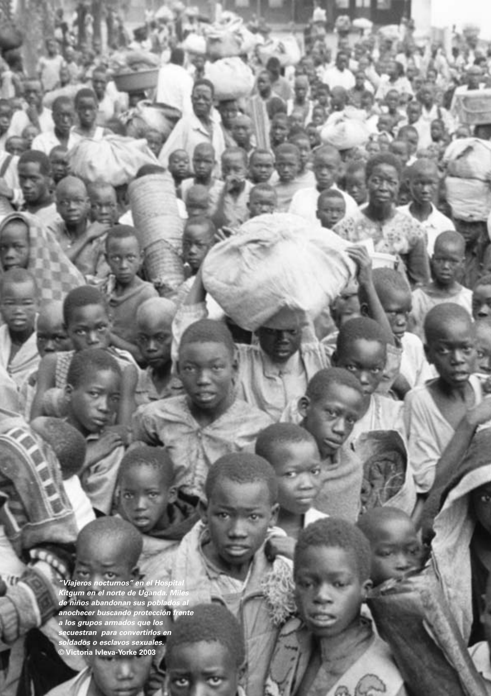
"Viajeros nocturnos" en el Hospital Kitgum en el norte de Uganda. Miles de niños abandonan sus poblados al anochecer buscando protección frente a los grupos armados que los secuestran para convertirlos en soldados o esclavos sexuales.