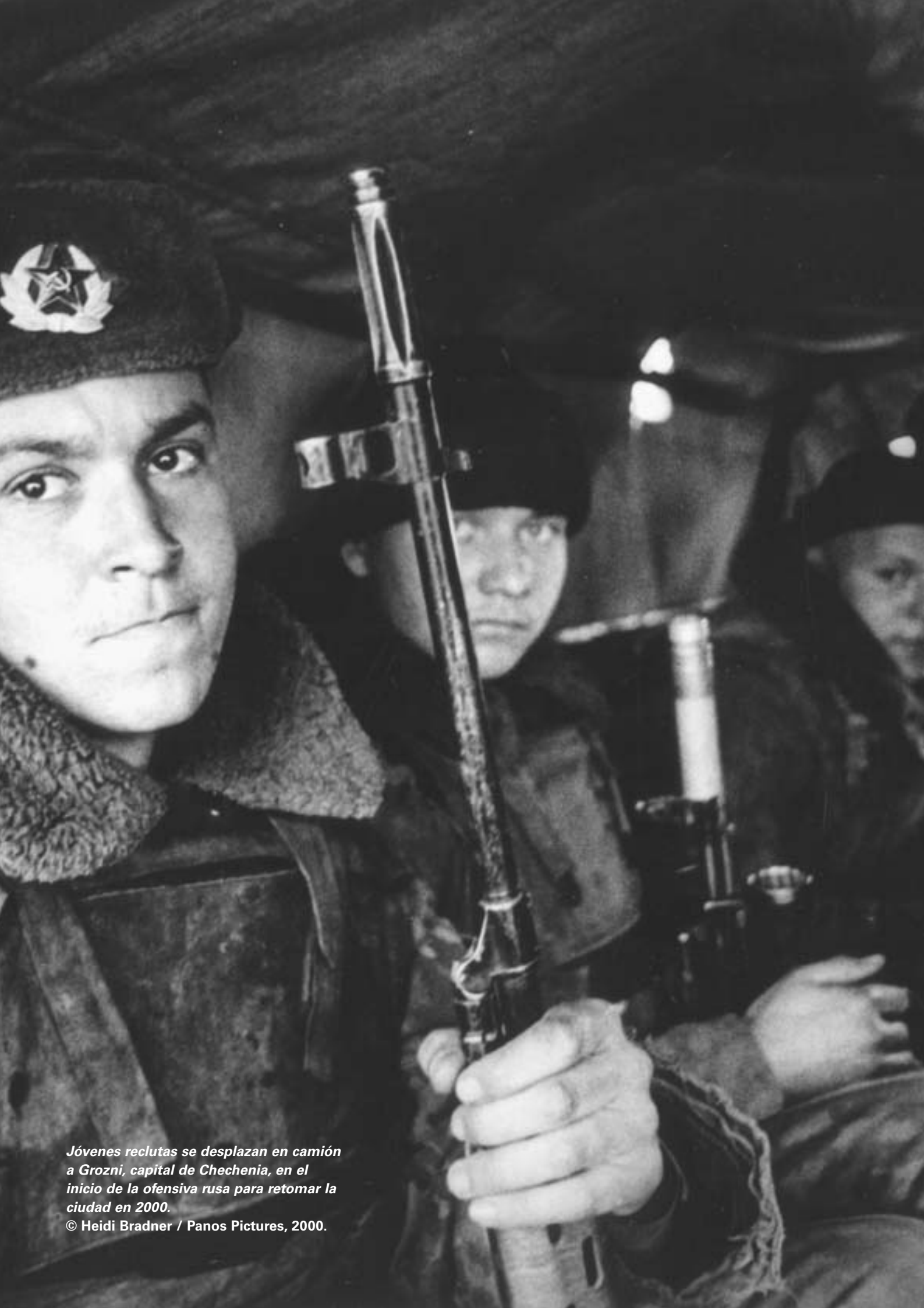
Jóvenes reclutas se desplazan en camión a Grozni, capital de Chechenia, en el inicio de la ofensiva rusa para retomar la ciudad en 2000.