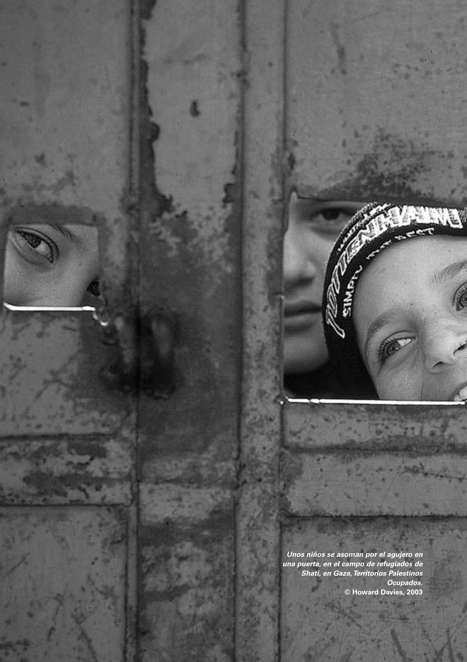
Unos niños se asoman por el agujero en una puerta, en el campo de refugiados de Shati, en Gaza, Territorios Palestinos Ocupados.