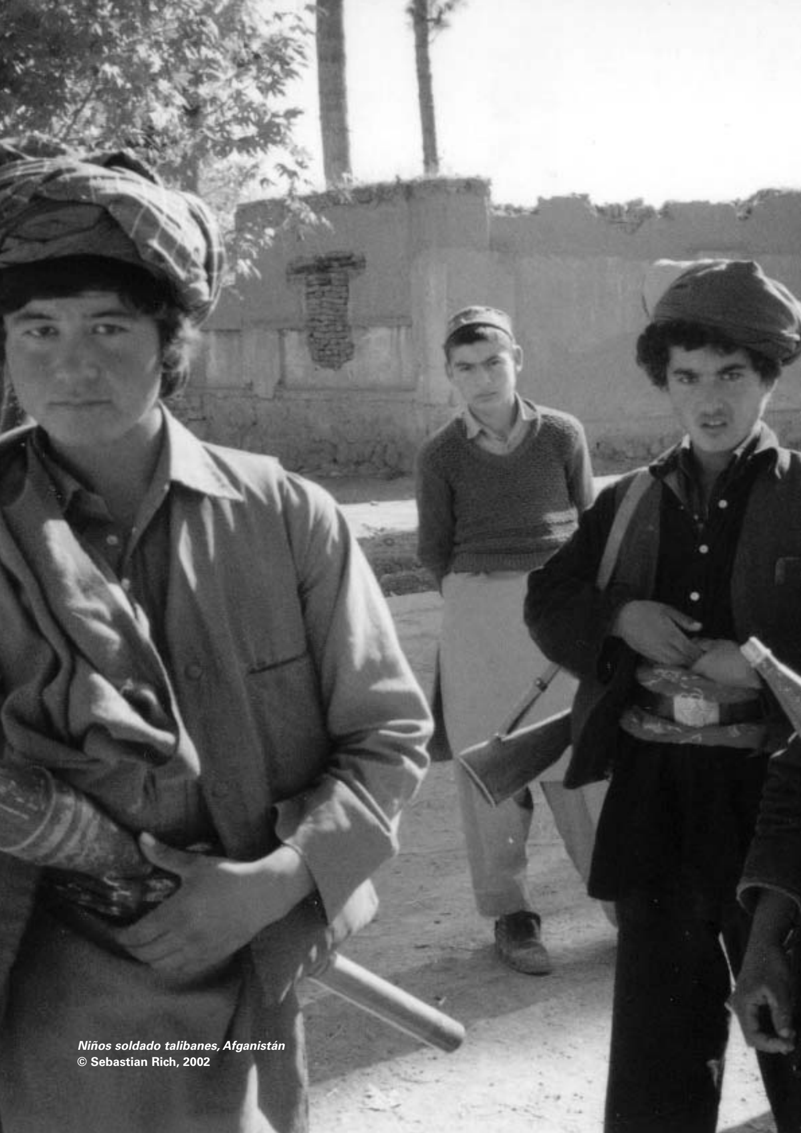
Niños soldado talibanes, Afganistán