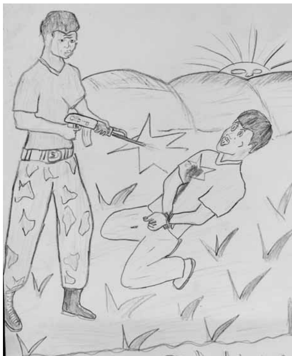
Dibujo de un ex niño soldado del grupo armado Fuerzas de Liberación Nacional, Burundi

Rellenaron los formularios y me preguntaron mi edad, y cuando dije "16" me abofeteó y me dijo: "Tienes 18. Responde 18". Me preguntó otra vez, y yo dije: "Pero esa es mi edad auténtica". El sargento preguntó: "¿Entonces, por qué te alistaste en el ejército?", y yo le respondí: "Contra mi voluntad. Me capturaron". Él dijo. "Bien, entonces mantén la boca cerrada", y rellenó el formulario. Yo sólo quería volver a casa, y se lo dije, pero ellos se negaron. Les dije: "Entonces, déjenme hacer solamente una llamada", pero se negaron también.