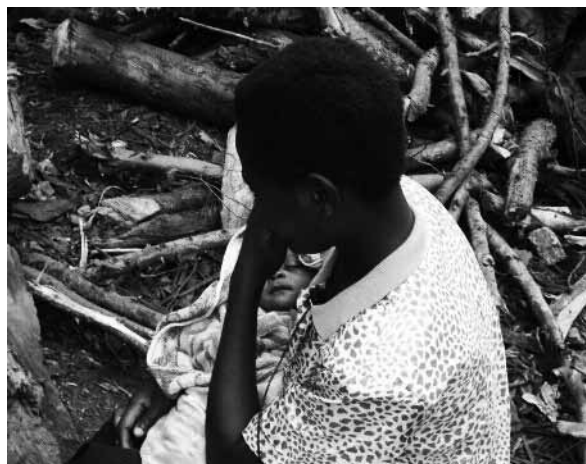
Ex niña soldado con un bebé al que dio a luz mientras estaba en un grupo armado, República Democrática del Congo.

Las razones por las que las niñas no han participado en los procesos oficiales de DDR son complejas. En numerosos conflictos de África, las muchachas han sido retenidas porque realizan útiles funciones de apoyo o se las considera como “esposas”. El Ejército de Resistencia del Señor, por ejemplo, se ha negado a dejar en libertad a unas 2.000 mujeres y a sus hijos alegando que son esposas e hijos de combatientes. Puede que las propias muchachas no deseen que se las identifique como niñas soldados por temor a sufrir el rechazo de sus familias y comunidades, tras considerarse que han “perdido valor” por haber tenido relaciones sexuales. A consecuencia de ello, muchas han regresado a sus comunidades de modo extraoficial, sin que se hayan cubierto sus necesidades médicas, económicas y psicosociales.