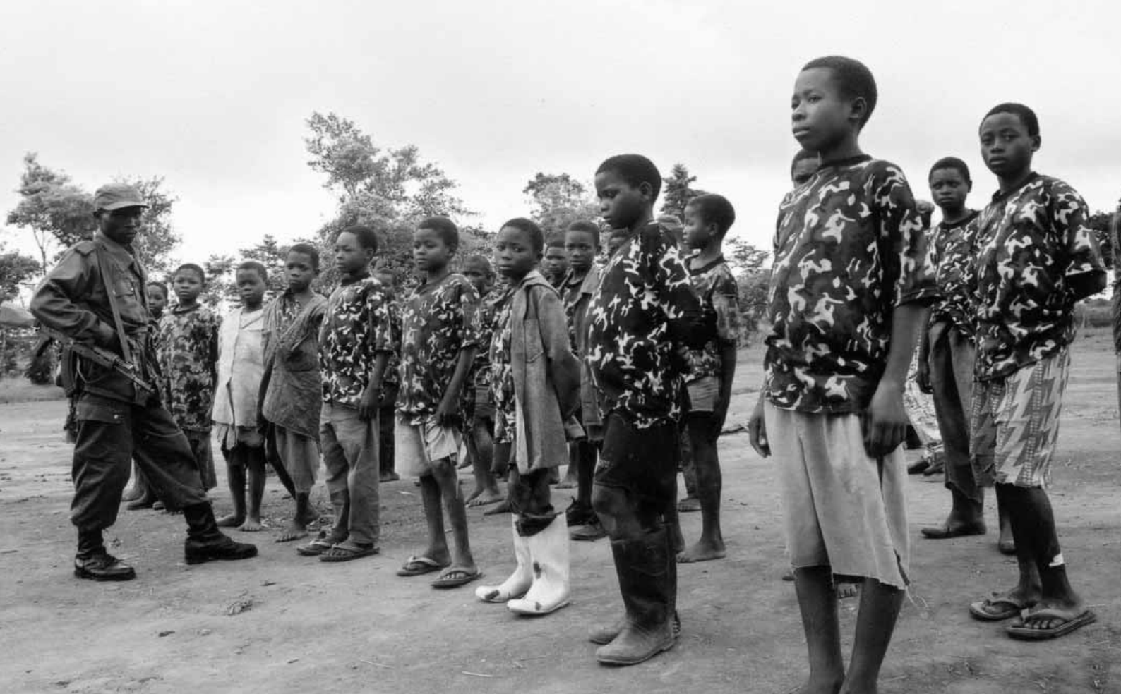
Niños soldados Mayi Mayi recibiendo instrucción en el "Campo de Entrenamiento Político" de Mangangu, Beni, República Democrática del Congo. Julio de 2003.

resolución del Consejo de Seguridad trató de imponer la prohibición de viajar y la congelación de fondos a los dirigentes de la República Democrática del Congo que reclutasen o utilizasen a niños y niñas soldados. 2