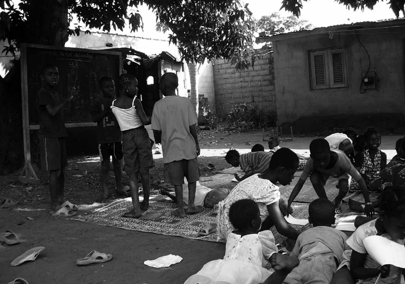
Niños y niñas en un grupo de una comunidad local junto a un campo militar en Bouaké, norte de Costa de Marfil.