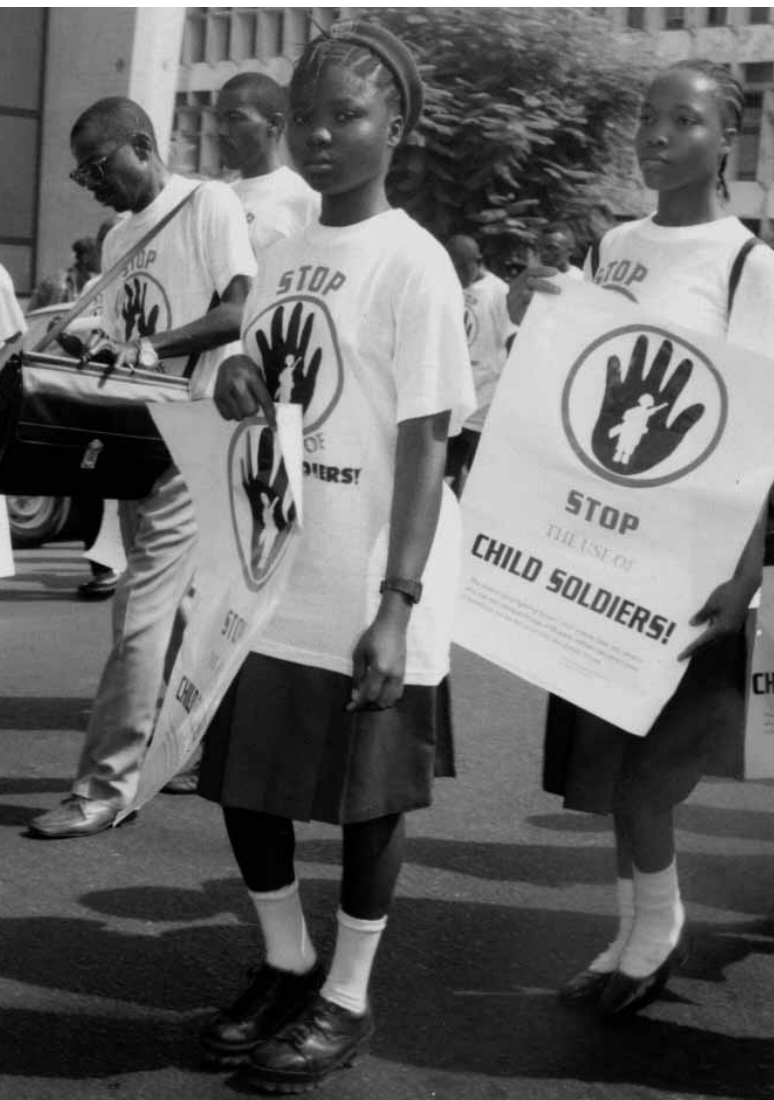
Varios cientos de escolares se manifiestan contra el uso de menores soldados. Freetown, Sierra Leona, 22 de marzo de 2000. El objetivo de la manifestación era el lanzamiento de la campaña de Caritas-Makeni contra el uso de niños y niñas soldados.

Oí a mis amigas hablar del desarme. Yo no podía desarmarme porque no tenía munición. Tengo amigas que pudieron desarmarse.