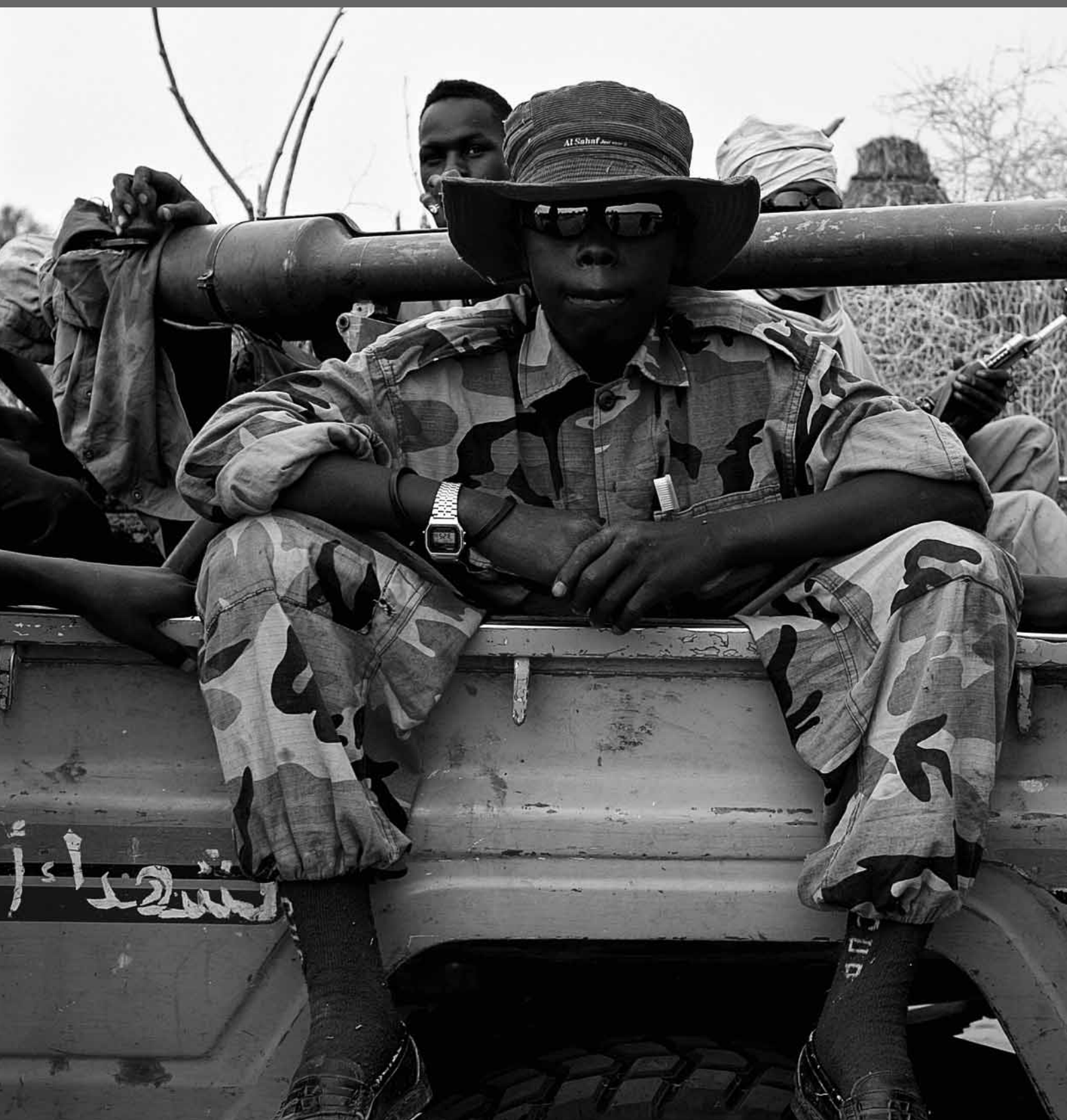
Jóvenes soldados sudaneses en el grupo armado Ejército de Liberación de Sudán, en territorio del grupo, norte de Darfur, Sudán.