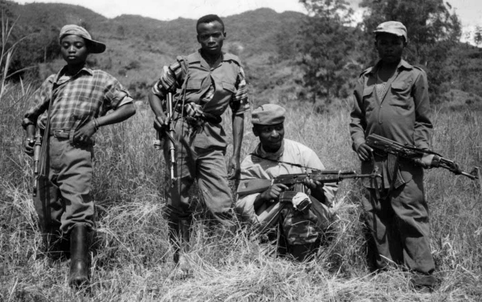
Niños soldados Mayi Mayi, en Kivu Norte, República Democrática de Congo, 2002.