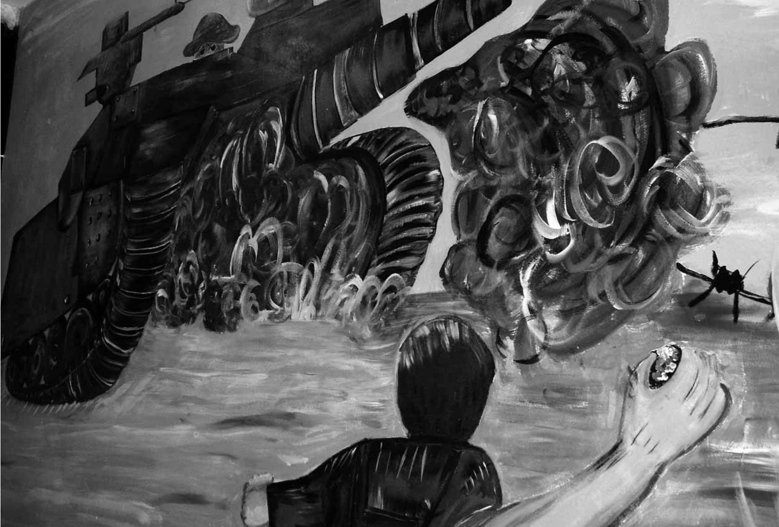
Mural en un centro para jóvenes en el campo de refugiados de Dheisheh, Belén, en el Banco Oeste.

en las normas internacionales sobre justicia de menores, en las que se hace hincapié en los objetivos de rehabilitación y justicia restitutiva, y en las mejores prácticas que se han acumulado en este campo. Además, en los debates también debe incluirse la experiencia de ex niños y niñas soldados, incluidos los que han participado –como víctimas de violaciones de derechos humanos, como responsables de ellas o ambas cosas– en procesos de justicia transicional, ya sean judiciales, no judiciales o tradicionales / consuetudinarios. También deben tenerse en cuenta las opiniones de las víctimas y de los miembros de las comunidades a las que han regresado o van a regresar los niños y las niñas soldados.