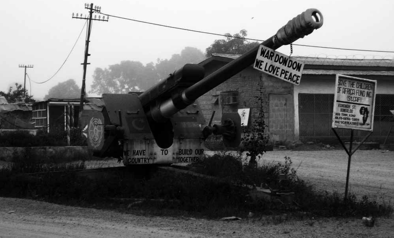
Monumento a la paz en Kono, antigua fortaleza del grupo armado Frente Unido Revolucionario, Sierra Leona.

dan mejor sus experiencias y se comprenda cómo ayudarles a que se recuperen y cómo proteger a los menores en el futuro.