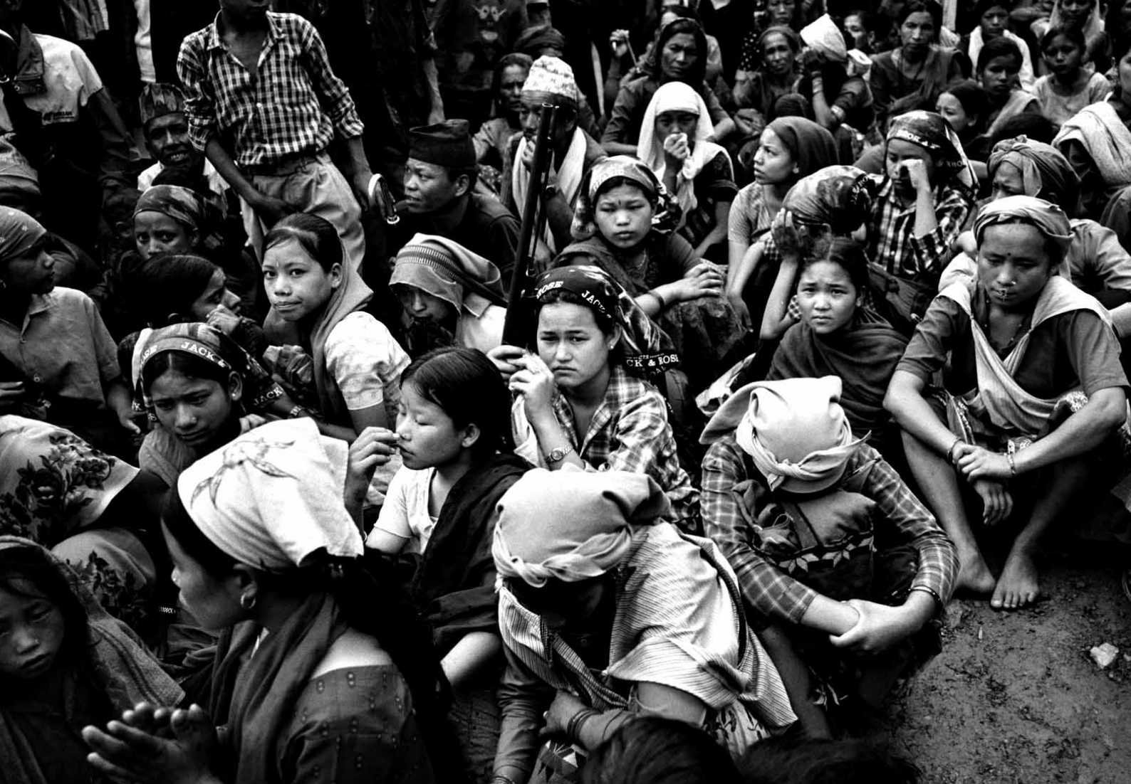
Niñas soldados junto a otras personas reunidas en un acto del Partido Comunista de Nepal (maoista) en Tila, distrito de Rolpa, Nepal.