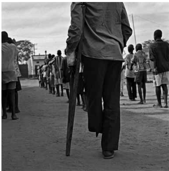
Ex niño soldado, mutilado como consecuencia de haber pisado una mina. Centro de rehabilitación World Vision, Gulu, norte de Uganda.

Al igual que ocurre con el reclutamiento para las fuerzas armadas, la educación merece especial atención, ya que las escuelas pueden formar parte del problema y, a la vez, de la solución. Al negárseles una educación adecuada, los menores que abandonan los estudios no están preparados para lograr un empleo en el mundo moderno y están más expuestos al reclutamiento por parte de grupos armados.