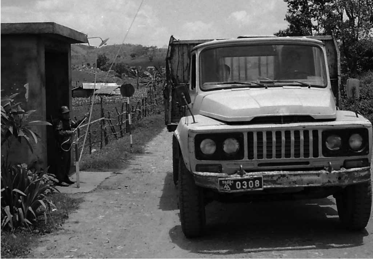
Niño soldado de la etnia Wa en el grupo de alto el fuego, Ejército Unido del Estado de Wa, en un puesto de control de la región de Wa, Estado de Shan, norte de Myanmar.

65 por ciento de los aproximadamente 4.000 menores que estudiaron en escuelas militares durante 2005 y 2006 se alistaron en el ejército. En Estados Unidos, se calcula que el 40% de los estudiantes que acaban la enseñanza secundaria y han pasado dos o más años en el Cuerpo de Adiestramiento de Oficiales Juveniles en la Reserva, en el que pueden participar desde los 14 años, acaban alistándose en el ejército. En la Federación Rusa, los menores de entre 12 y 15 años, muchos de ellos huérfanos, que ingresan en escuelas para cadetes no tienen forma legal de revocar su decisión de asistir a ellas o su compromiso de trabajar en el ejército una vez hayan finalizado los estudios.