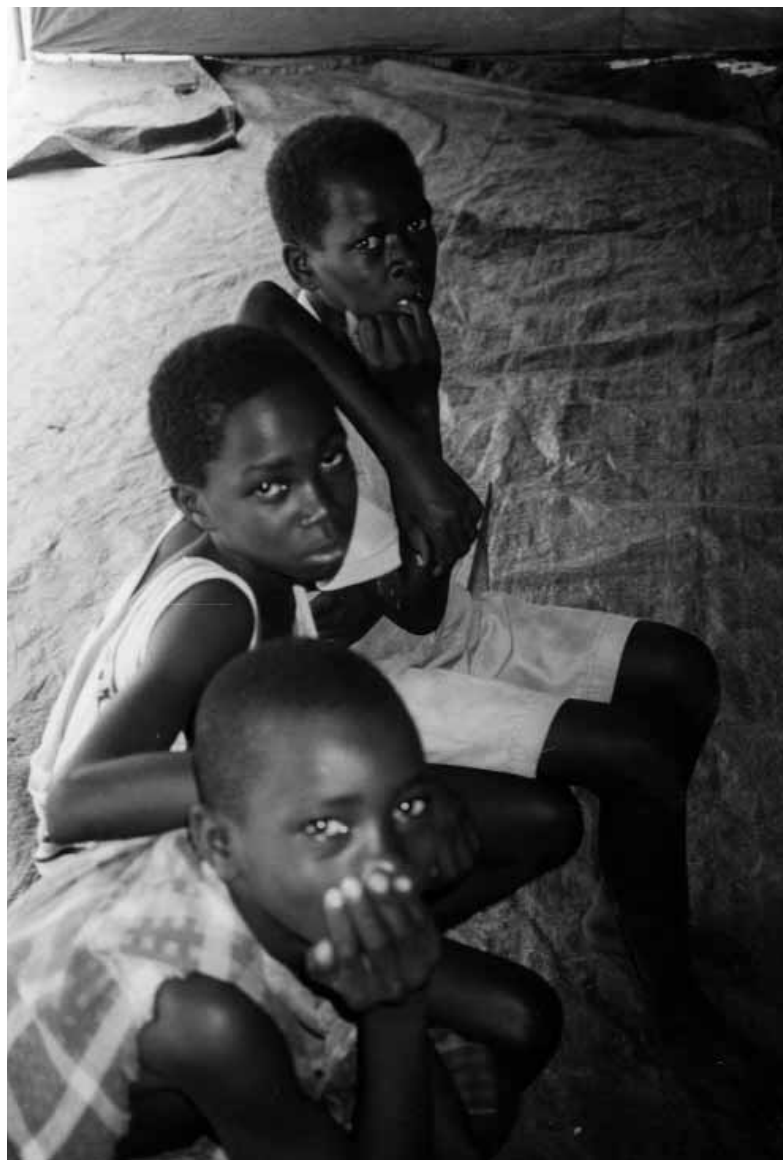
Ex menores soldados, Bujumbura.

También resulta más probable que los menores se vean arrastrados hacia grupos armados tras haber sufrido violaciones de derechos humanos u otras formas de violencia, incluida la doméstica. Los gobiernos y las sociedades que no dan prioridad a la promoción y protección de los derechos de los niños y niñas –tanto económicos, sociales y culturales como civiles y políticos– son también responsables de que los menores acaben engrosando las filas de los grupos armados.